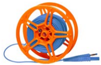
Prüfleitung 15 m auf Spule blau