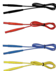
Prüfleitung 1,2 m (Bananenstecker) schwarz / rot/ blau / gelb

WASONBUOGB1 WASONREOGB1 WASONBLOGB1 WASONYEOGB1