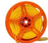
Prüfleitung 50 m auf Spule (Bananensteckern) gelb