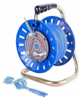
Prüfleitung auf einer Rolle blau 75 m / 100 m / 200 m

WAPRZ075REBBSZ WAPRZ100REBBSZ WAPRZ200REBBSZ