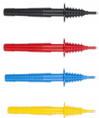
Tastsonde mit Bananenbuchse schwarz / rot/ blau / gelb

WASONBUOGB1 WASONREOGB1 WASONBLOGB1 WASONYEOGB1